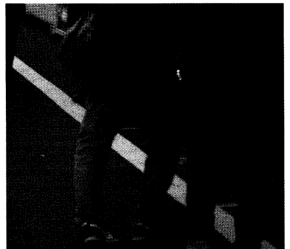
図4. 老人もジーンズをはく。巣鴨で。

の戦後史 19) の中の個人の主観的表白などにも、社会の変化と個人の主観との乖離を見出すことが出来る。