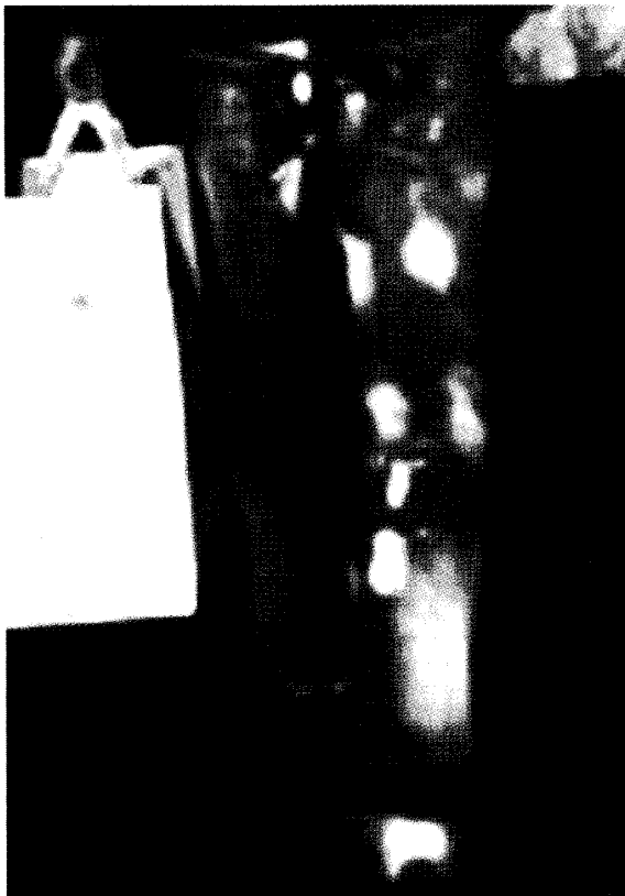
図2. ブリーチングの模様のももある。