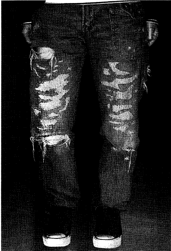
図1. ジーンズのすだれ状の破れ。緯糸が残っていることが多い。