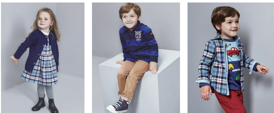
図8 専業子供服メーカーの一例『MIKI HOUSE』2017年秋冬の製品

てその購買決定者である母親たちの支持に繋がっていたからである(図8)。総合アパレルメーカーにおいても、婦人/紳士/子供とそれぞれが異なるブランドを展開しており、同一ブランド内で男女、或いは年齢が異なる商品展開はD.C.ブランド以外での事例はない。