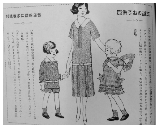
図3 「三越のお子供服」の一例