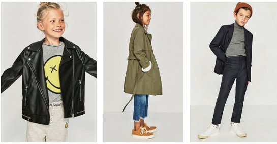
図7 ファストファッションの子供服の一例『ZARA キッズ』2017年秋冬の製品