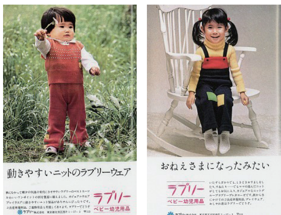
図4 雑誌『婦人友』に掲載された子供服の広告の一例

産業としての子供服の本格的な幕開けは、婦人服同様、第二次世界大戦後のことである。1947年にキムラタン、翌年にベビージョップ・モトヤ（現在のファミリア）が創業した。企業の創業が相次いだのは、第二次ベビーブームを迎えた1970年代である。1971年には『MIKI HOUSE』を手掛ける三起商行が創業したと同時に、チャイルド、フーセンウサギを始めとする子供服メーカーの成長が顕著に見られたのもこの時代である。