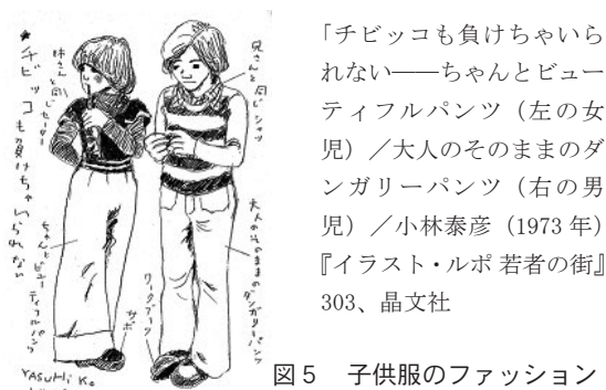
図5 子供服のファッション

1970年代半ば頃までは専門メーカーの躍進が目立ったものの、1980年代に入ると、売上上位の企業群には総合アパレルメーカーが名を連ねるようになる。創業時は婦人服、あるいは紳士服専門の企業が、子供服市場の拡大に対応する形で参入を始めた。この