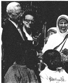
Bono (center) with O'Neill (left)

Bono, the lead singer of U2, and U. S. Treasury Secretary Paul O'Neill will go together on a ten-day trip to four countries in Africa—Ghana, South Africa, Uganda and Ethiopia—to see how effectively development assistance is working.